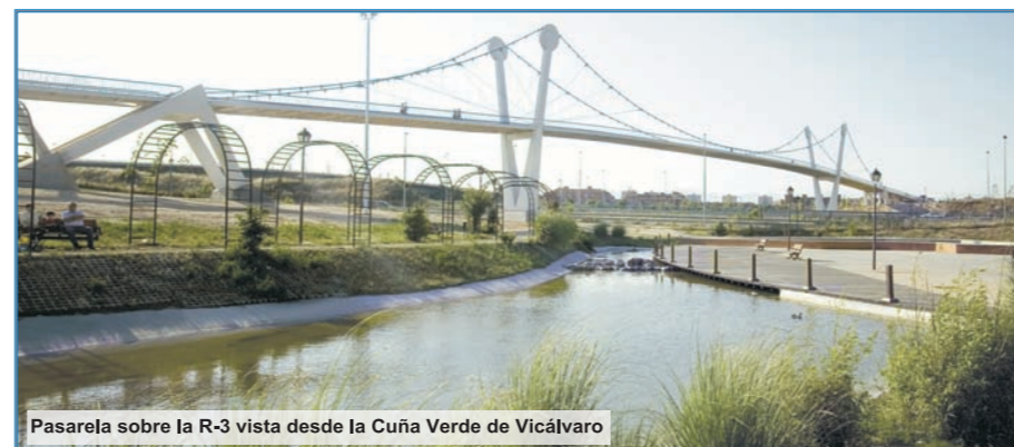
Pasarela sobre la R-3 vista desde la Cuña Verde de Vicálvaro